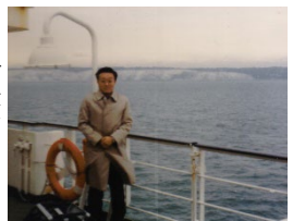
ドーバーの白い壁を背景に

その後オーストラリアでの営業活動、ドイツの同業他社との技術提携などを経験しながら1988年米国コネチカット州に設立したジョイントベンチャー会社の経営を命じられ赴任することになりました。