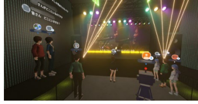
メンバー専用で開催されたコンサート

このわいわいサロンは始まったばかりなので、今から参加しても現在のメンバーとの知識の差はほとんどありません。「面白そうだ、やってみよう」と踏み出すことが、認知症予防にも役立つと思われる。参加したい方はぜひ一緒にやりましょう。