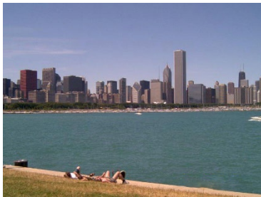
ミシガン湖と摩天楼

私が関与していた切削型工作機械（マシニングセンター）ももろに影響を受け、事業活動の縮小を余儀なくされ、本拠を米国東海岸のミネソタ州に置くデメリットが顕在化してきました。そこで交通の要地かつ米国製造業の中心的存在である Midwest (中西部)の中心地シカゴに拠点を移すことになり、1992年後半より建屋・要員の確保作業に着手しました。シカゴ市の近郊北西にはコネティカットとは違って日系企業が進出しやすい風土が確立しており、同業他社や和食レストランも数多く存在していました。昼食にラーメンが食べられるなど出向社員にはたまらない魅力の地です。