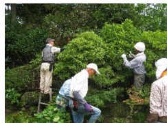
SLF ガーデンサポート：庭木の剪定風景