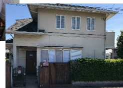
現在のプチカル 柏の葉外観