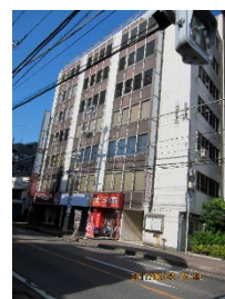
柏ビルディングへ移転